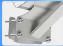
Soporte de montaje

La batería y controlador se localizan en el interior de la lámpara.