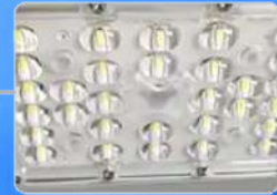
LED de alta luminosidad